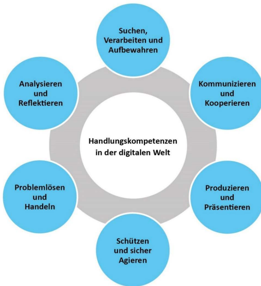
Abbildung 2: Kompetenzen in der digitalen Welt

Da die berufliche Bildung wesentlich von der Digitalisierung und deren Rückwirkung auf Arbeits-, Produktions- und Geschäftsabläufe betroffen ist, wurden zusätzlich zum Kompetenzrahmen der vorgenannten KMK-Strategie und ihrer Ergänzung sieben spezifische Anforderungen für berufliche Schulen formuliert, die neben dem Verständnis für digitale Prozesse ebenfalls die mittelbaren Auswirkungen der fortwährenden Digitalisierung, z. B. hinsichtlich arbeitsorganisatorischer und kommunikativer Aspekte in teilweise global vernetzten Geschäftsbeziehungen, einschließen: