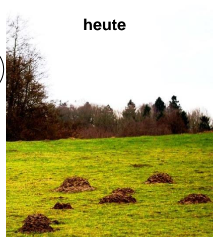
Wiese mit und ohne Maulwurfshügel