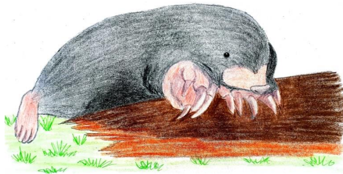
Bild: Maulwurf

1. Lies den Informationstext zum Maulwurf. Ergänze den Steckbrief.