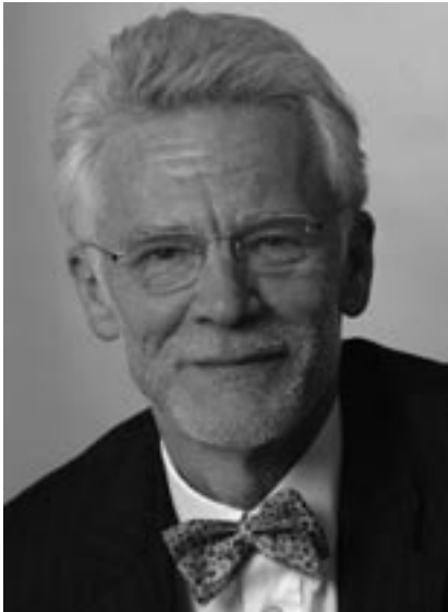
Prof. Dr. E. Jürgen Zöllner Senator für Bildung, Wissenschaft und Forschung

Sehr geehrte Damen und Herren, liebe Lehrerinnen und Lehrer,